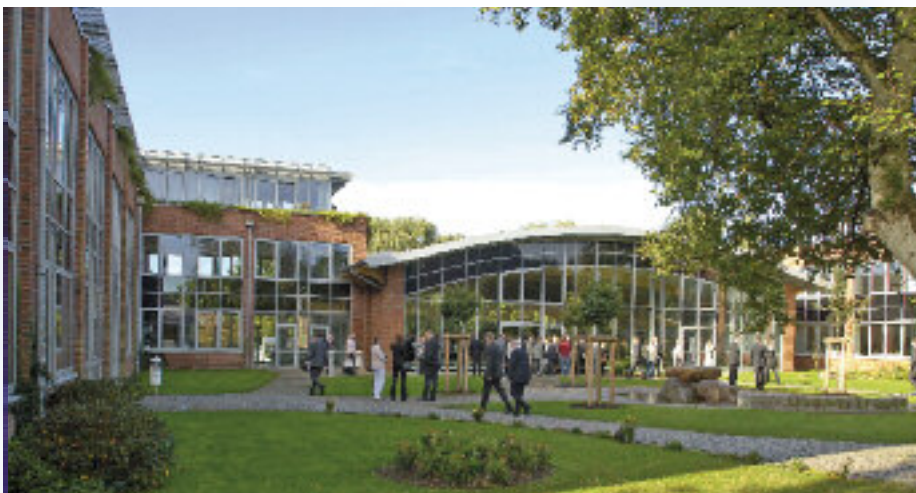
Die NORDAKADEMIE als 35. Hochschulgruppe des VWI

Wer den VWI und natürlich unsere Hochschulgruppe kennenlernen möchte, kann sich unter www.vwi-nordakademie.de informieren und sich für das nächste Treffen nach den Nachschreibeklausuren im 4. Quartal anmelden.