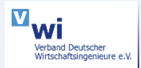
Das Logo des Verbandes

Nachdem die ersten Hürden genommen wurden, geht es nun in die aktive Phase. Das erste Großevent des VWI, an dem die Mitglieder aktiv teilnehmen