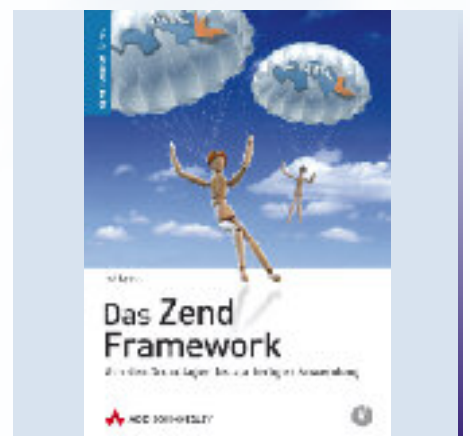
Ralf Eggerts Buchtitel

gen Anwendung“ richtet sich primär an alle Einsteiger in das Zend Framework, die ihre ersten Schritte mit dem Framework starten möchten. Als Autodidakt kann der IT-erfahrene Leser lernen, wie man dynamische Webseiten erstellt. Geboten wird ein Programmiergerüst, innerhalb dessen der Programmierer eine Anwendung erstellt. Er sollte die Scriptsprache PHP5 und die objektorientierte Programmierung beherrschen. Ralf Eggerts Buch hilft ihm dann dabei, ein neues Internetprojekt umzusetzen oder einer bestehen-