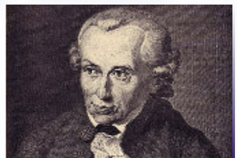
Der Philosoph Immanuel Kant

Die Kinder waren sehr aufmerksam und stellten viele Fragen, z. B. über die Atombombe, den Kalten Krieg oder Kindersoldaten in Afrika. Die Fragen zeigten, dass die Kinder, die alle im Alter zwischen acht und zwölf Jahren sind, sich mit dem wichtigen Thema beschäftigen und auch aktuelle Entwicklungen in der Weltpolitik kennen. Viele der Kinder hatten das Thema auch schon mit ihren Eltern und insbesondere den Großeltern, die häufig von ihren eigenen Erfahrungen aus dem 2. Weltkrieg berichten können, diskutiert.