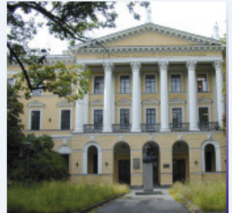
St. Petersburg State University of Economics and Finance ist die Partnerhochschule der NORDAKADEMIE

Eine Führung durch die Brauerei Baltika stand danach auf dem Programm. Die Brauerei gehört zur Carlsberg-