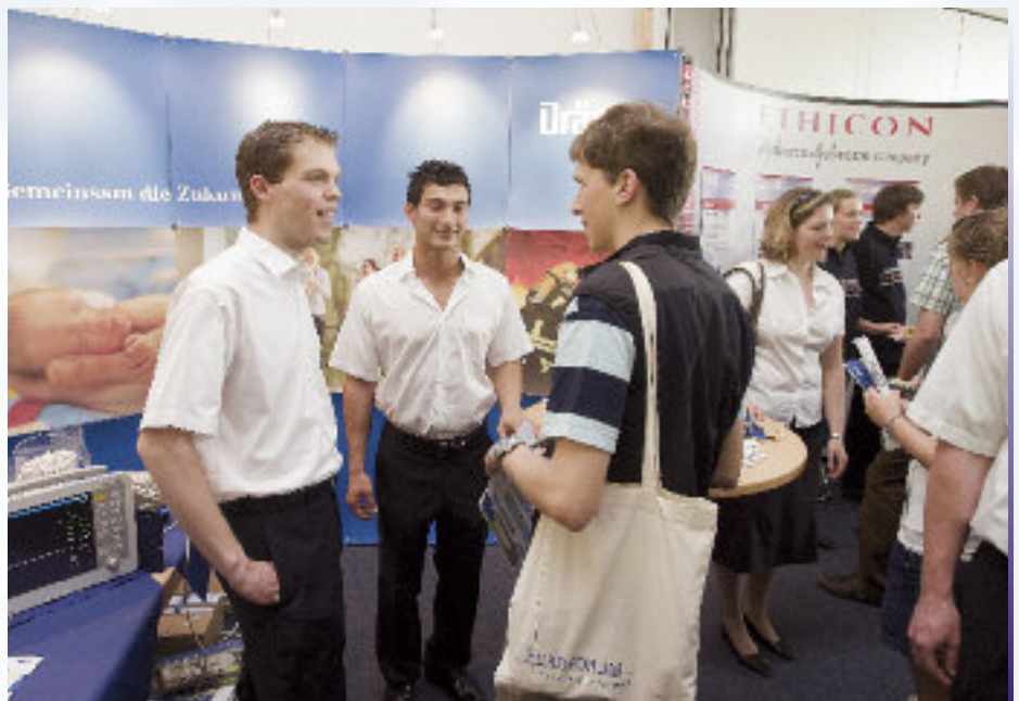
Studieninteressenten informierten sich am Tag der offenen Tür der NORDAKADEMIE über das Studienangebot der Hochschule

Zum Studienbeginn im Herbst 2010 vergeben 130 Kooperationsbetriebe, die aus allen Branchen kommen, insgesamt 350 Studienplätze in den Fachrichtungen Betriebswirtschaftslehre, Wirtschaftsingenieurwesen und Wirtschaftsinformatik.