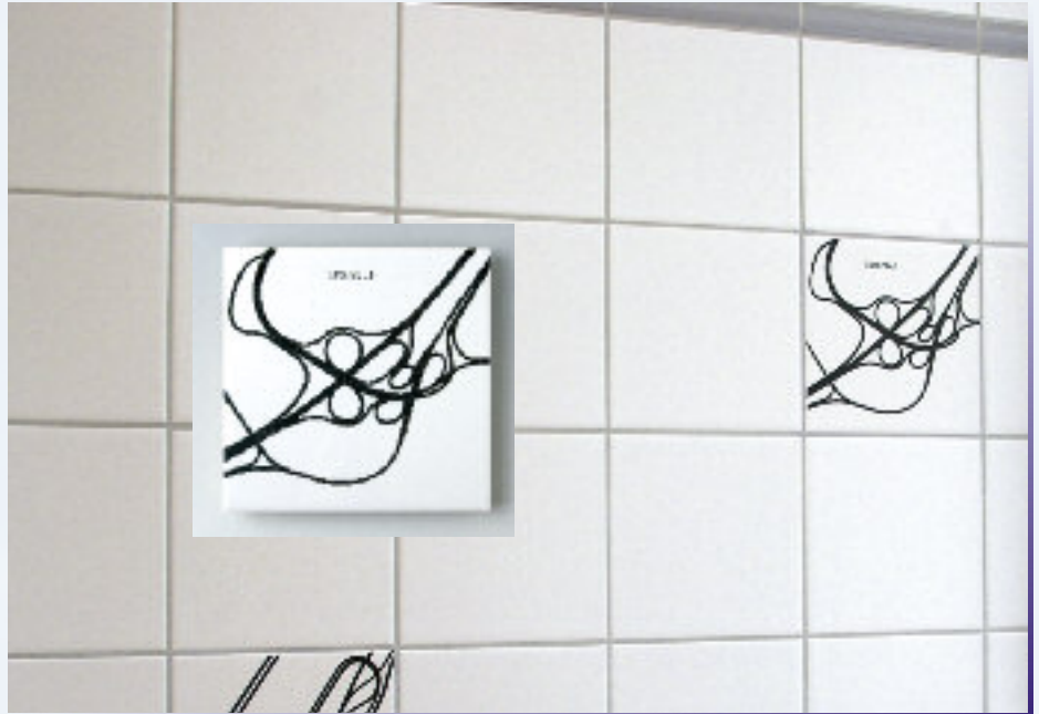
Istanbul-Design im Dozentenappartement der NORDAKADEMIE

Jim TerMeer arbeitet an der School of the Art Institute of Chicago, einer Kunsthochschule, die seit mehr als 15 Jahren auf Platz 1 im Ranking des US News & World Report Magazine geführt wird. Das am Ufer des Lake Michigan gelegene und zur Hochschule gehörende Museum „Art Institute of Chicago“ besitzt mit dem Original der im Foyer der NORDAKADEMIE hängenden Reproduktion „Night Hawks“ von Edward Hopper bedeutende Werke zeitgenössischer Kunst.