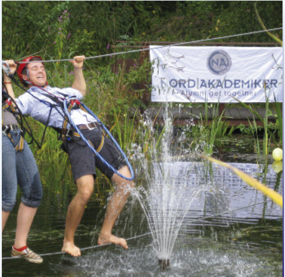
Um zum Stand der NORDAKADEMIKER auf dem Sommerfest der Hochschule zu gelangen, war sportliches Geschick und Abenteuerlust erforderlich

Viele nähere Informationen zur Akademie sowie alle Updates zum Programm der NORDAKADEMIKER sind auch unter www.nordakademi-ker.de zu finden.